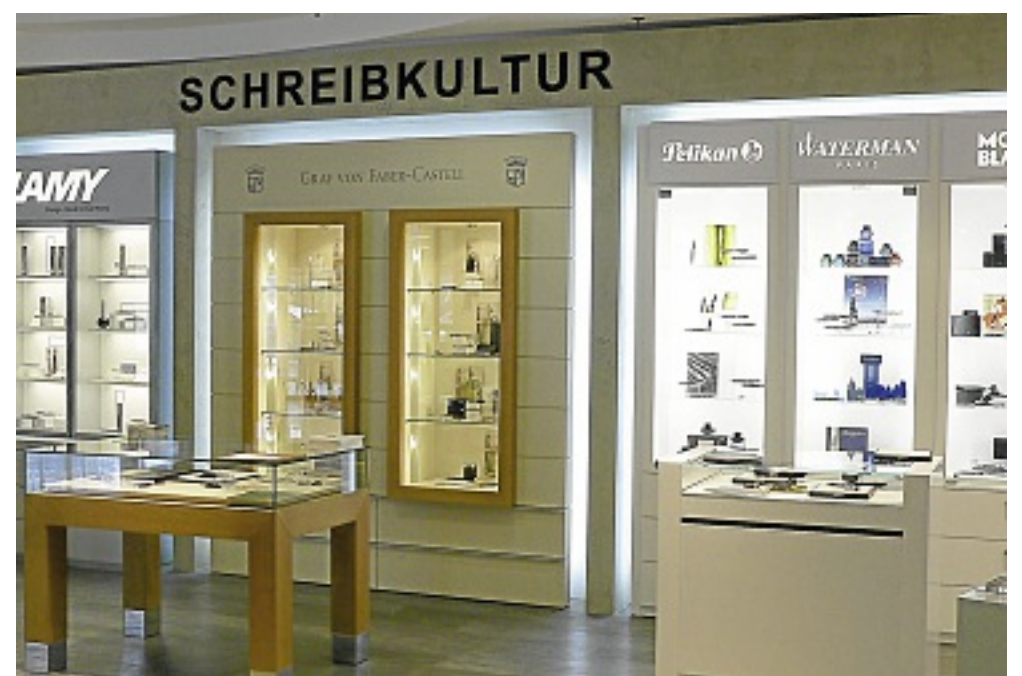
Anhänger der Schreibkultur finden im Fachmarkt eine reiche Auswahl hochwertiger Schreibgeräte.

Neue Inspirationen erhalten kreative Gestalter durch Aktionen, die die Firma Arttoz im Fachmarkt anbieten wird. Seit 30 Jahren stellt das Schweizer Unternehmen schöne und qualitativ hochwertige sowie innovative Papeterie- und Kreativprodukte her. Individuell gestaltet sind auch die Fotoalben. „Wir arbeiten mit einigen kleineren deutschen Unternehmen zusammen, die ausgewählte, sich saison-