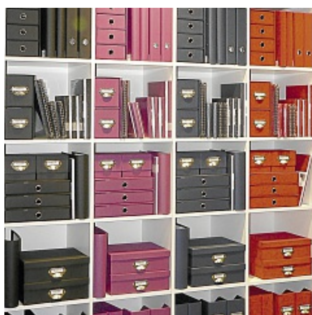
Ordnungssysteme im Büro können nicht nur praktisch, sondern auch höchst dekorativ sein.

fallene Ideen“, weiß der Marktleiter. Passend zum fertig gepackten Geschenk aber auch für jeden anderen Anlass kann der Kunde Grußkarten aus über 1000 Motiven auswählen.