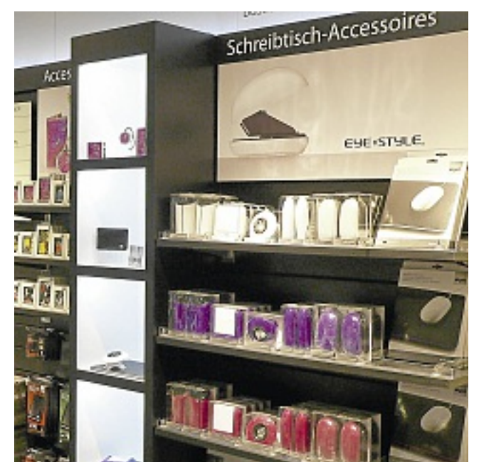
Ein echter Hingucker ist der Sigel Stil-Shop. Er setzt Schreibtisch-Accessoires gekonnt in Szene.

Büromöbel für Kinder und Erwachsene komplettieren die Angebotspalette. Auch die Planung der Büroeinrichtung wird übernommen.